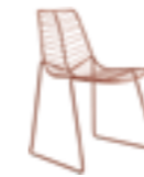
Slitta impilabile Stackable sled