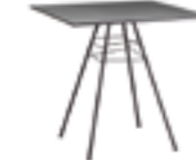
h 74 cm