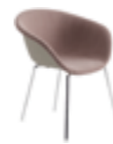
4 gambe 4 legs