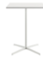
h 105 cm