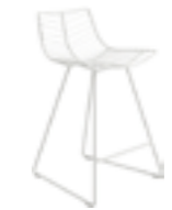
Sgabello counter slitta in acciaio Counter stool sled