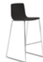
Sgabello bar Bar stool