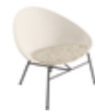
4 gambe 4 legs