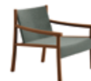
Struttura in massello di robinia Solid black locust frame