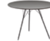
h 74 cm