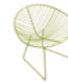
Slitta lounge Lounge sled