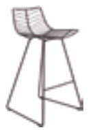
Sgabello bar slitta in acciaio Bar stool sled