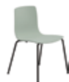
4 gambe 4 legs