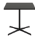
h 74 cm