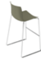
Sgabello counter Counter stool