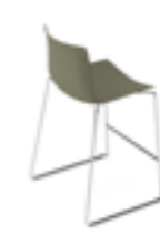
Sgabello bar Bar stool