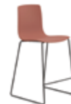
Sgabello Counter stool