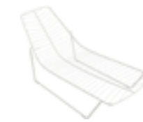
Chaise longue Chaise longue