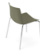
4 gambe 4 legs