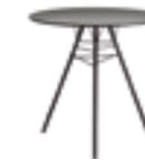
h 74 cm