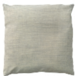
Cuscino 45x45 cm Art. 5268